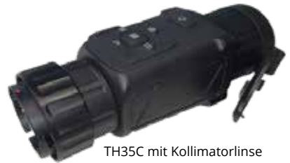
TH35C mit Kollimatorlinse

Dieser ist nicht inkl. und kann separat erworben werden