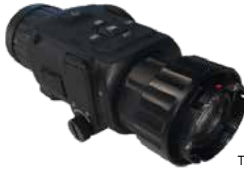
TH35C mit Kollimatorlinse