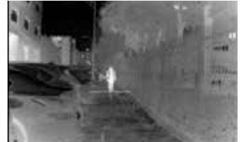
Festlegen der oberen Kante des Objekts