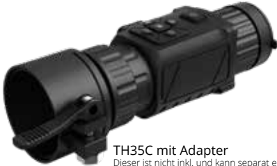
TH35C mit Adapter

Bei dem Funktionsumfang und Gesamtpackage liegt dieses Produkt im Vergleich zu anderen Clip-On Geräten weit vorne. Es hat ein optimales Preis-Leistungsverhältnis und kann sowohl als Beobachtungs-gerät als auch als CLIP-ON benutzt werden.