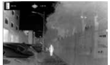
Festlegen der unteren Kante des Objekts